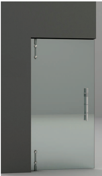
Pivotación a dintel