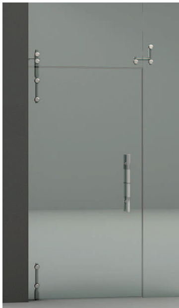
Pivotación a banderola y pared