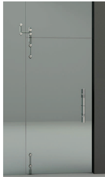
Pivotación a banderola y paño fijo